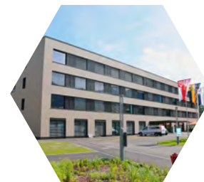
Kantonsspital Obwalden Sarnen

Seit 1976 besteht AGP, für über 40 Schweizer Spitäler haben wir Konzept-Studien, Bewertungsanalysen, Medizintechnikplanungen und Betriebsplanungen durchgeführt.