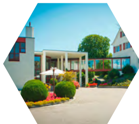
Klinik Seeschau Kreuzlingen

Seit 1976 besteht AGP, für über 40 Schweizer Spitäler haben wir Konzept-Studien, Bewertungsanalysen, Medizintechnikplanungen und Betriebsplanungen durchgeführt.